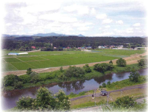
鮭延城跡から真室川町を望む

文明 8年(1476) 佐々木綱村、近江国より下り仙北小野寺氏の関口の番城を預かる 天文 4年(1535) 貞綱のとき、戸沢村岩鼻に入る この頃、鮭延城を築く 永禄 5年(1562) 秀綱誕生 永禄 6年(1563) 庄内武藤氏より岩鼻楯を攻められる 秀綱2歳で武藤氏の人質となる 天正10年(1582) 秀綱21歳のとき、庄内から戻り鮭延城主となる 天正13年(1585) 最上義光による鮭延城攻めの後、最上家の家臣となる 元和 8年(1622) 最上家改易 秀綱、老中土井利勝の預かりとなる 元和 9年(1623) 秀綱罪を許され、下総国佐倉藩(千葉県)へ、五千石を賜り土井利勝の客人となる 寛永10年(1633) 土井利勝の古河藩(茨城県)転封に伴い、秀綱も移る 正保 3年(1646) 秀綱没する(享年84歳) 家臣14名が土井家に仕官する 慶安 元年(1648) 秀綱の菩提寺として鮭延寺が建立される(茨城県古河市)