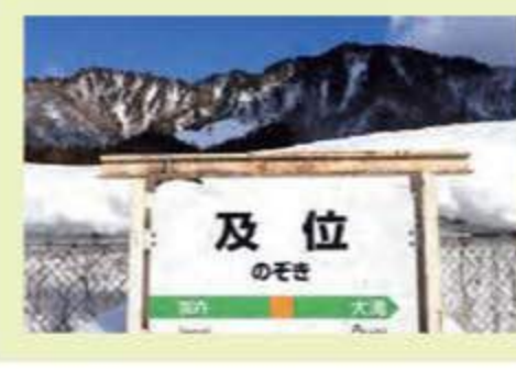
及位 難読駅名で有名な奥羽本線「及位」駅。諸説ありますが、山岳信仰が盛んだった時代、多くの修行僧が果敢にそびえる山にこもり、断崖から雷つりになり、横穴をのぞくといった「のぞき」と呼ばれるという修行を行い、高い位を授けられたことにより「のぞき」の行により「及位」となるといわれています。