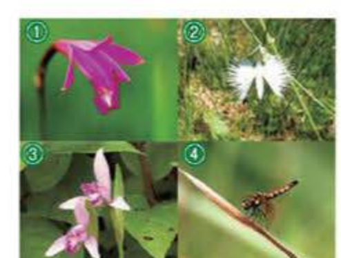
① サワラン ② サギソウ ③ トクソウ ④ ハッチョウトンボ(メス)