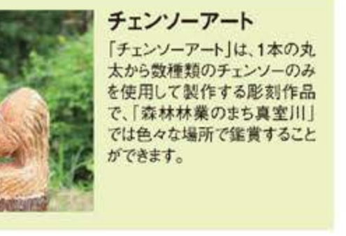
チェーンソーアート 「チェーンソーアート」は、1本の丸太から数種類のチェーンソーのみを使用して製作する彫刻作品で、「森林林業のまち真室川」では色々な場所で鑑賞することができます。