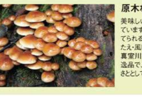
原木なめこ 美味しい山の幸に恵まれています。山岳信仰が盛んだった時代、多くの修行僧が果敢にそびえる山にこもり、断崖から雷つりになり、横穴をのぞくといった「のぞき」と呼ばれるという修行を行い、高い位を授けられたことにより「のぞき」の行により「及位」となるといわれています。