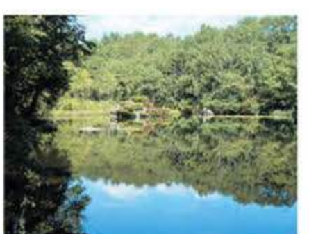
名勝沼 C-1 飯山山麓の湧水を水源とし、中央部には「中の島(浮き島)」があり、四季折々の景色が広がります。