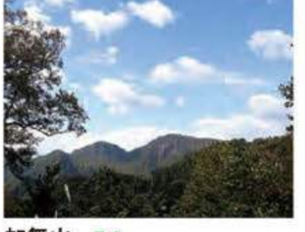
加無山 B-2 男加無(997m)・女加無(924m)からなり、展望台の岩場からは鳥海山までが眺望できます。山形百名山