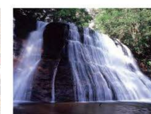
不動明王の滝 A-3 落差は約5メートル。心地よい滝音にふれ、涼やかな空気に包まれることができます。