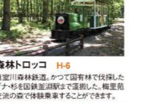
森林トロッコ H-6 真室川森林鉄道。かつて国有林で伐採したブナ杉を国鉄釜淵駅まで運搬した。梅里苑交流の森で体験乗車することができます。