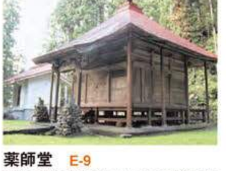
薬師堂 E-9 国重要文化財に指定されている「銅像如来傳像」が祀られており、5月8日と8月15日の年2回の御開帳があります。