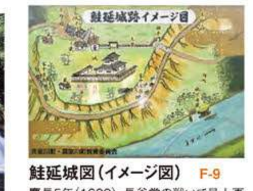
鮭延城跡(イメージ図) F-9 慶長5年(1600)、長谷堂の戦いで最上軍の武将として活躍し、戦将である直江兼続に「信玄、謙信にも覚えなし」といわれた名将鮭延秀綱の居城跡。城跡からは、真室川や田園風景が見下ろせます。