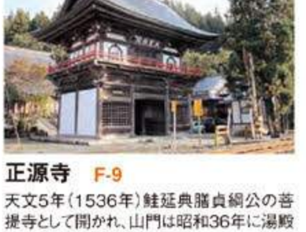
正源寺 F-9 天文5年(1536年)鮭延典義貞綱公の菩提寺として開かれ、山門は昭和36年に湯殿山大日坊から移築されました。