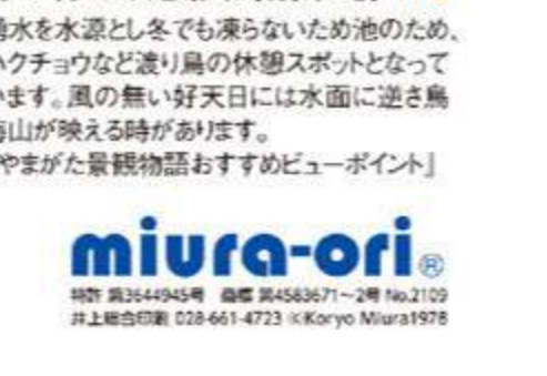
野々村ため池(白鳥飛来地) H-9 湧水を水源とし、冬でも凍らないため池のため、ハッチョウトンボなど渡り鳥の休憩スポットとなっています。風の無い好天日には水面に逆さ鳥海山が映る時があります。「やまがた景観物語」おすすめビューポイント