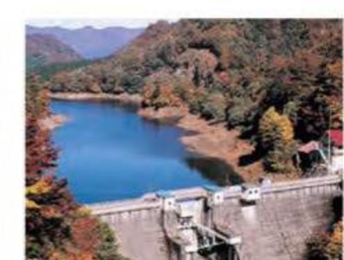
高坂ダム A-2 鮭川流域の治水と発電を目的として昭和42年に建設。ダム湖の梅花里湖ではバードウォッチングや釣りを楽しめます。