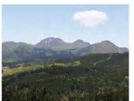
飯山 C-1 修験者の山岳修行の場とされていた男鹿山(981m)、女鹿山(979m)。裾野ではカツラの巨木が鎮座シブナ林が広がっています。県立自然公園。山形百名山