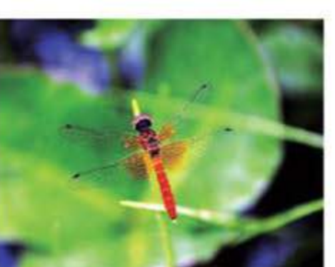
中村湿原 A-4 日本最小とされる「ハッチョウトンボ」が生息する湿原。トンボをはじめ希少な昆虫・植物が生息しています。真室川町指定天然記念物。